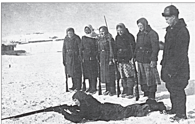
Во время урока НВП в Визингской школе.

Отец мой был командиром сапёрной роты в составе 1197 стрелкового полка 4-й ударной армии. Участвовал в боях с немецкими захватчиками под Москвой и на Калининском фронте. За боевые заслуги был награждён орденом Красной Звезды. Но сам он, как и многие фронтовики,